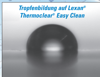
Kontaktwinkel von nahezu 100°

Diese Beschichtung ist auf der Aussenseite von LEXAN® Thermoclear® Sheet aufgebracht und verhindert die Bildung von grossen Wasserflächen und darüber hinaus Schmutzansammlungen. Diese werden bei einsetzendem Regen nahezu von selbst weggewaschen.