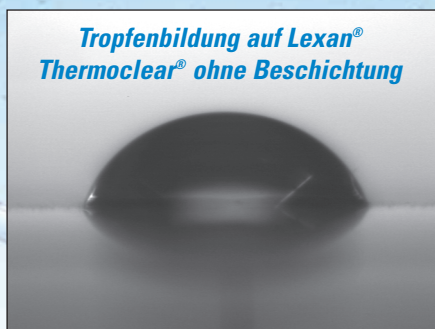
Kontaktwinkel von 66°