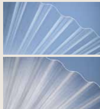
Querschnitt der PLEXIGLAS® Resist WP 130/30 (Maße in mm)